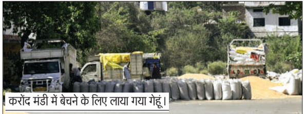
करोड़ मंडी में बेचने के लिए लाया गया गेहूँ।

मुख्यमंत्री यह भी देखेंगे कि शासन-प्रशासन की ओर से उपलब्ध कराई जाने वाली सभी सुविधाएं किसानों को प्राप्त हो रही है या नहीं। आकरिमिक निरीक्षण के