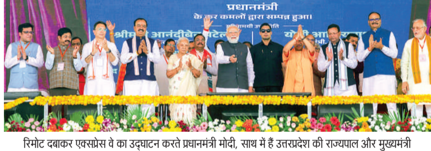
रिमोट दबाकर एक्सप्रेसवे का उद्घाटन करते प्रधानमंत्री मोदी, साथ में हैं उत्तरप्रदेश की राज्यपाल और मुख्यमंत्री

यह उत्तर प्रदेश की लाइफ लाइन, मां गंगा का आशीर्वाद