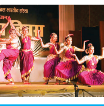
नृत्य की मनमोहक प्रस्तुति।