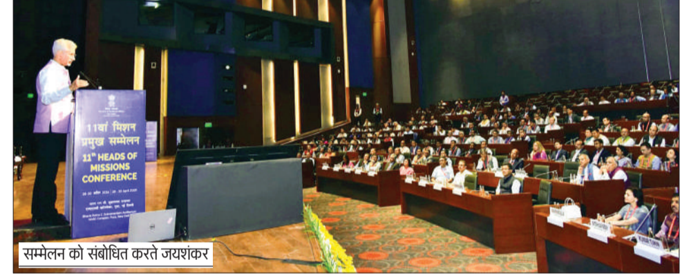
सम्मेलन को संबोधित करते जयशंकर

भारतीय राजनयिकों के सम्मेलन को एस. जयशंकर ने किया संबोधित भारतीय राजनयिकों का यह सम्मेलन ऐसे वक्त हो रहा है जब पश्चिम एशिया संकट की वजह से भारत के सामने भी कई चुनौतियां हैं। इस सम्मेलन की तस्वीर सोशल मीडिया प्लेटफॉर्म एक्स पर पोस्ट करते हुए विदेश मंत्री एस. जयशंकर ने लिखा कि नई दिल्ली में 11वें राजदूतों और उच्चायुक्तों के सम्मेलन में भारत के हाई कमिश्नर, राजदूत और विदेश मंत्रालय के अधिकारियों को संबोधित किया। हमारी बातचीत में पिछले दशक में दुनिया के साथ भारत के जुड़ाव में हुई काफी बढ़ोतरी को पहचाना गया।