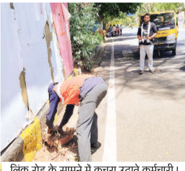
लिक रोड के सामने में कचरा उठाते कर्मचारी।

शहर में खाली दीवारों पर सुंदर पेंटिंग बनाने, 234 सुलभ कॉम्प्लेक्स का रंग-रोगन करने का काम तेजी से शुरू हो गया है। बुधवार को कई कॉम्प्लेक्स पर रंगाई-पुताई के साथ आकर्षक पेंटिंग की गई।