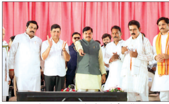
जलूद सोलर पावर प्लांट का लोकार्पण करते सीएम डॉ. यादव

मुख्यमंत्री ने कहा कि इस परियोजना में कोई भी व्यक्ति एकर-एक लाख के 10 बॉन्ड खरीद सकता है। एक लाख पर लगभग 8 प्रतिशत की बचत होगी, जिसका लाभ 20 साल तक मिलेगा। अगर जरूरत पड़े तो इस बॉन्ड को बेचा भी जा सकता है।