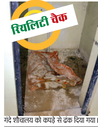
गंदे शौचालय को कपड़े से ढक दिया गया।