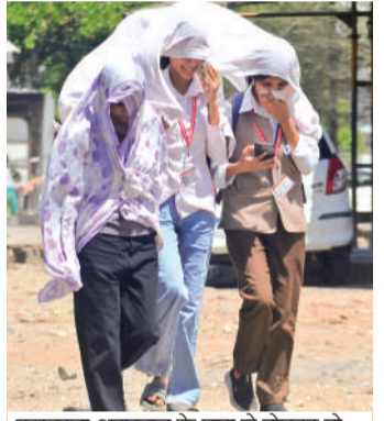
कस्तूरबा अस्पताल के पास से दोपहर दो बजे भीषण गर्मी में गुजरती तीन युवतियां।