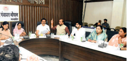
जिला पंचायत में साधारण सभा की बैठक चर्चा करते अधिकारी।