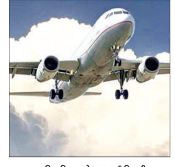
हरिभूमि ब्यूरो ► नई दिल्ली

देश की प्रमुख विमानन कंपनियों के संगठन ऑफ इंडियन एयरलाइंस (एफआईए) ने सरकार को अलर्ट करते हुए कहा है कि एविएशन टर्बाइन फ्यूल (एटीएफ) यानी विमानन ईंधन की कीमतों में भारी बढ़ोतरी से एयरलाइन उद्योग गंभीर संकट में पहुंच गया है। एयर इंडिया, इंडिगो और स्पाइसजेट जैसे बड़ी एयरलाइंस का प्रतिनिधित्व करने वाले एफआईए ने कहा है कि यदि जल्द राहत नहीं दी गई तो उड़ानें रद्द करनी पड़ सकती हैं और कई परिचालन बंद होने की नौबत आ सकती है। एफआईए ने 26 अप्रैल को सरकार को पत्र लिखकर 1 मई को होने वाली अगली एटीएफ मूल्य समीक्षा से पहले तत्काल हस्तक्षेप की मांग की है।