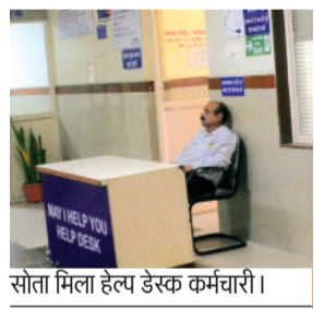
सीता मिला हेलप डेस्क कर्मचारी।