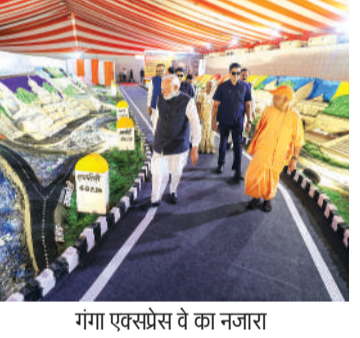
गंगा एक्सप्रेसवे का नजारा

594 किमी लंबा एक्सप्रेसवे 36,230 करोड़ की लागत से बना 12 जिलों को जोड़ेगा यह गंगा वे