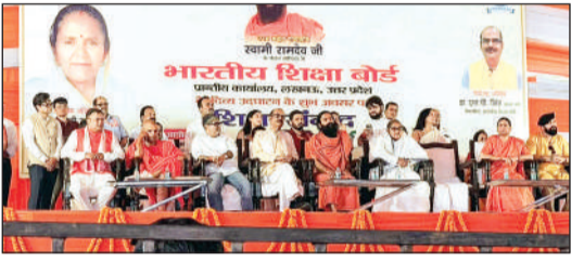
एक लाख विद्यालयों को भारतीय शिक्षा बोर्ड से जोड़ा जाएगा