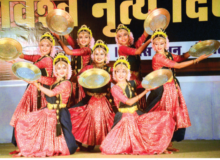
विश्व नृत्य दिवस पर मानस भवन में नृत्य प्रस्तुत करती युवतियां।