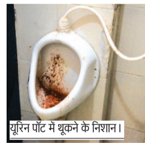
यूरिन पॉट में थूकने के निशान।