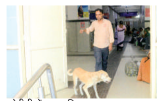
ओपीडी में घूमता मिला कुत्ता।