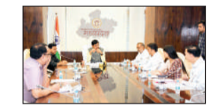
ओर से दी जाने वाली यह सामाजिक सुरक्षा पेंशन राशि सिर्फ आर्थिक सहायता नहीं, यह सरकार के उस विश्वास का अंतरण है, जो इस बात >>> शेष पेज 6 पर

हरिभूमि न्यूज >>> मोपाल मुख्यमंत्री डॉ. मोहन यादव ने कहा कि राज्य सरकार समाज के सभी निर्धन, निराश्रित, युद्धजनों, कल्याणी, परिव्यक्त, अविवाहिता एवं दिव्यांगजनों के कल्याण एवं आर्थिक सहायता के लिए विभिन्न प्रकार की पेंशन योजनाएं संचालित करती है। सरकार की >>> शेष पेज 6 पर