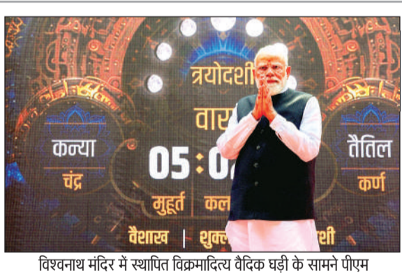
विश्वनाथ मंदिर में स्थापित विक्रमादित्य वैदिक घड़ी के सामने पीएम

सीएम डॉ. यादव की पहल पर वैदिक घड़ी द्वादश ज्योतिर्लिंगों में स्थापित की जा रही है