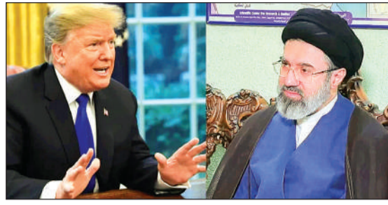
ईरान के प्रस्ताव से नाराज हुए ट्रंप बड़ा सियासी संकट

अमेरिकी राष्ट्रपति डोनाल्ड ट्रंप ने ईरान को 3 दिन का अल्टीमेटम देते हुए कहा है कि तेल पाइपलाइनों में बढ़ते दबाव के कारण ईरान बड़ी तबाही की ओर है। वहीं, ईरानी राष्ट्रपति मसूद पेजेकिचियान ने होमरुज नाकाबंदी हटाने की शर्त रखी है