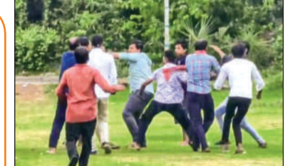
हुगली जिले के खानकूल में टीएमसी और निर्दलीय प्रत्याशी के कार्यकर्ताओं के बीच मारपीट

नॉर्थ 24 परगना में टीएमसी-भाजपा कार्यकर्ताओं में हिंसा >>> शेष पेज 6 पर