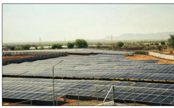
जलूद सोलर पावर प्लांट

मुख्यमंत्री डॉ. यादव ने कहा कि महेश्वर-मंडलेश्वर क्षेत्र ज्ञान-विज्ञान का केंद्र रहा है। महर्षि मंडन मिश्र के नाम से प्रसिद्ध इस क्षेत्र में उनका शंकराचार्य से शास्त्रार्थ हुआ था, तब मंडन मिश्र ने अपनी पत्नी को न्यायाधीश की जिम्मेदारी सौंपी थी। यह घटना देश के इतिहास में नारी सशक्तिकरण का सबसे बड़ा उदाहरण थी। मुख्यमंत्री डॉ. यादव ने कहा कि लोक माता अहिल्या बाई होल्कर ने कठिन दौर में भी देशभर के सनातनी मंदिरों को भव्यता के साथ विकसित किया। प्रदेश में गेहूँ का उपार्जन कार्य व्यवस्थित रूप से हो रहा है। हमारी सरकार ने 2 साल में गेहूँ का भाव 400 रुपये प्रति विंटल से अधिक बढ़ाकर किसानों को लाभ दिया है।